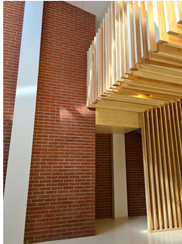
Tegelväggen från 1981 möter trätrappan från 2021. Nu är Skärlagskolan en stor byggnad!